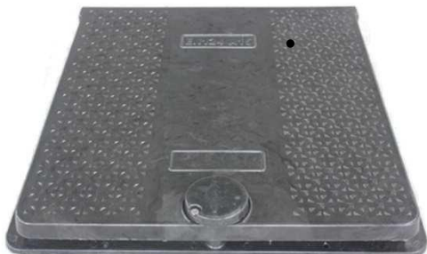
Model PK-23 (bez odvetrávania)