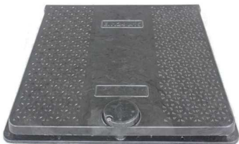
Model PK-24 (bez odvetrávania)