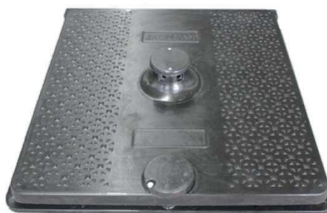
Model PK-26 (s odvetrávaním a mriežkou)